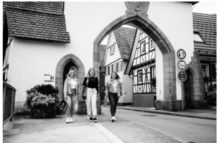
Ein Tag in Oppenau

Außerdem kommen zahlreiche weitere Vergünstigungen in über 150 Schwarzwaldgemeinden noch hinzu. Die Renchtal Tourismus GmbH hat hierzu einen neuen Flyer aufgelegt. Dieser ist in den Servicestellen der Renchtal Tourismus GmbH sowie online unter www.renchtal-tourismus.de verfügbar.