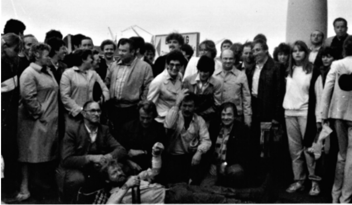
Ausflug der Freiwilligen Feuerwehr Lautenbach nach Hamburg und Helgoland 1981

Die Gemeindeverwaltung nimmt gerne Fotos oder alte Postkarten entgegen, die für die Veröffentlichung im Verkündblatt und für Mitbürger interessant sind. Die Fotos werden nur kurzfristig als Leihgabe benötigt und im Original wieder zurückgeben. Wer interessante Fotos oder historisches Material von Lautenbach hat und nicht mehr benötigt, kann diese auch gerne zur Archivierung im Rathaus abgeben. Ansprechpartner hierzu ist Frau Elke Müller 07802-925915 oder rathaus@lautenbach-renchtal.de