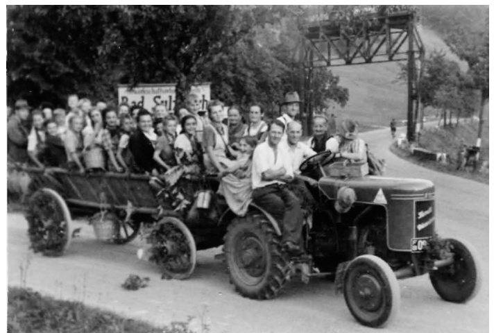
Heidelbeersuche im Sulzbach Jahreszahl unbekannt

Die Gemeindeverwaltung nimmt gerne Fotos oder alte Postkarten entgegen, die für die Veröffentlichung im Verkündblatt und für Mitbürger interessant sind.