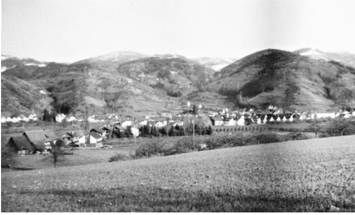
Siedlung mit Blick Richtung Sohlberg – Jahreszahl unbekannt

Die Gemeindeverwaltung nimmt gerne Fotos oder alte Postkarten entgegen, die für die Veröffentlichung im Verkündblatt und für Mitbürger interessant sind.