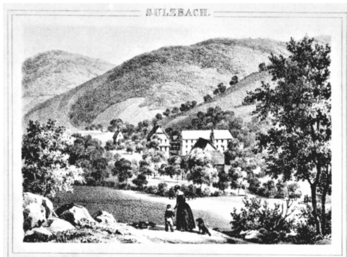
Bad Sulzbach im 19. Jahrhundert

Die Gemeindeverwaltung nimmt gerne Fotos oder alte Postkarten entgegen, die für die Veröffentlichung im Verkündungsblatt und für Mitbürger interessant sind.