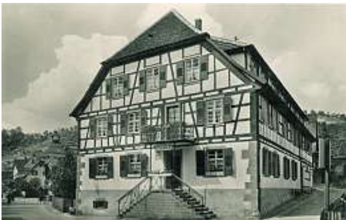
Gasthaus Schwanen vermutlich in 1950-Jahren

Die Gemeindeverwaltung nimmt gerne Fotos oder alte Postkarten entgegen, die für die Veröffentlichung im Verkündblatt und für Mitbürger interessant sind.