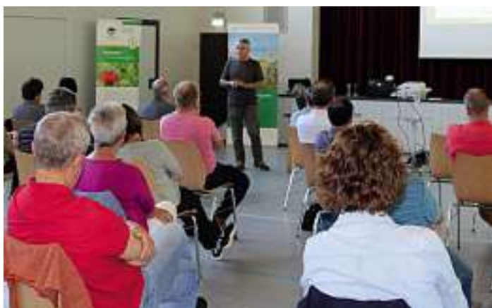
Die Auftaktveranstaltung zum Pilotprojekt „Blühende Gemeinde“ stieß bei den Lautenbachern auf reges Interesse.