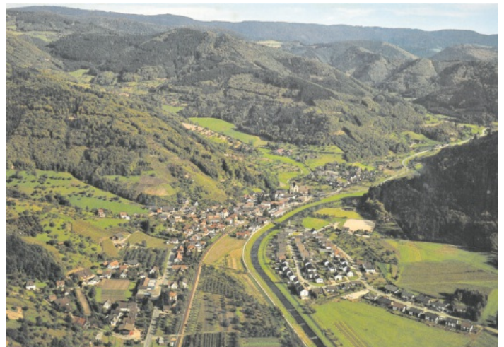
Luftbilddaufnahme ca. 1980

Die Gemeindeverwaltung nimmt gerne Fotos oder alte Postkarten entgegen, die für die Veröffentlichung im Verkündblatt und für Mitbürger interessant sind.