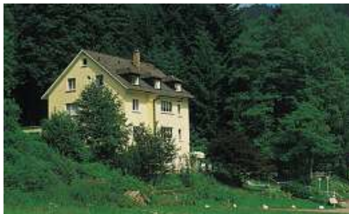
Cafe Waldfrieden 1988

Die Gemeindeverwaltung nimmt gerne Fotos oder alte Postkarten entgegen, die für die Veröffentlichung im Verkündblatt und für Mitbürger interessant sind.