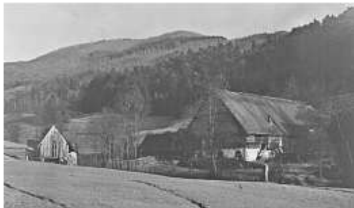
Hof im Rüstenbach vermutlich in den 1920-Jahren

Die Gemeindeverwaltung nimmt gerne Fotos oder alte Postkarten entgegen, die für die Veröffentlichung im Verkündblatt und für Mitbürger interessant sind.