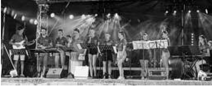
Santa Maria

Herzliche Einladung an jung und Junggebliebene!