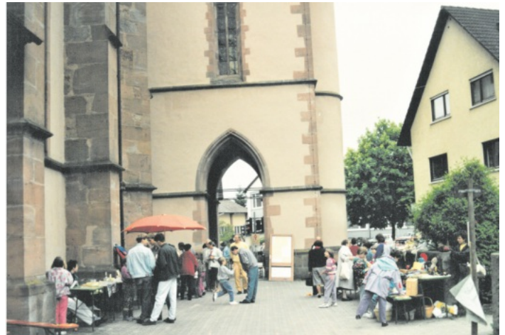
Flohmarkt an der Kirche Juli 1991