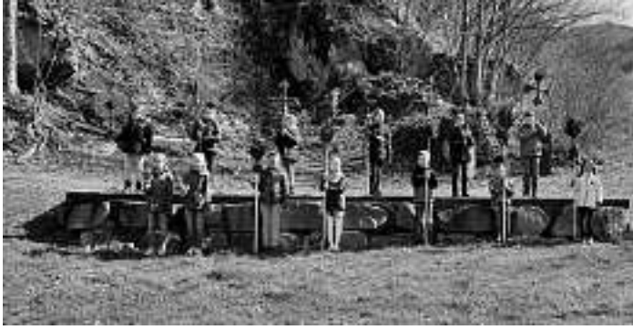
Die Erstkommunionkinder brachten festlich geschmückte Palmen mit in den Gottesdienst.