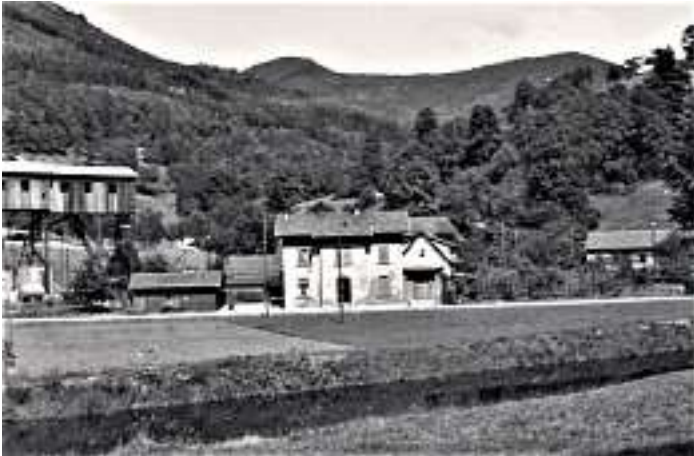
Bahnhof Huberacker – Ansicht vom Wald ca. 1960

Die Gemeindeverwaltung nimmt gerne Fotos oder alte Postkarten entgegen, die für die Veröffentlichung im Verkündblatt und für Mitbürger interessant sind.