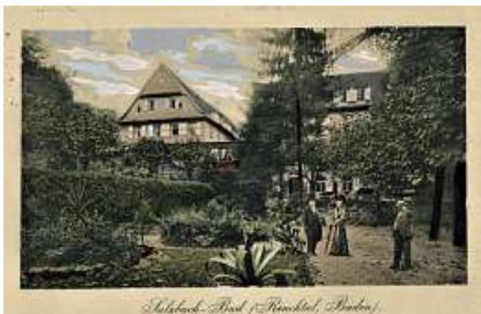
Bad Sulzbach um 1900

Die Gemeindeverwaltung nimmt gerne Fotos oder alte Postkarten entgegen, die für die Veröffentlichung im Verkündblatt und für Mitbürger interessant sind.