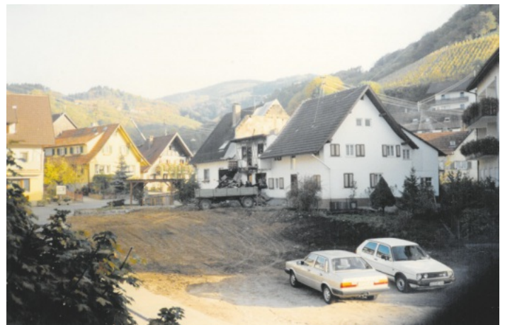
Nach Abriss Hauptstr. 45 – heutiger Bachdatscherlebrunnen Im Jahr 1989

Die Gemeindeverwaltung nimmt gerne Fotos oder alte Postkarten entgegen, die für die Veröffentlichung im Verkündblatt und für Mitbürger interessant sind. Die Fotos werden nur kurzfristig als Leihgabe benötigt und im Original wieder zurückgeben. Wer interessante Fotos oder historisches Material von Lautenbach hat und nicht mehr benötigt, kann diese auch gerne zur Archivierung im Rathaus abgeben.