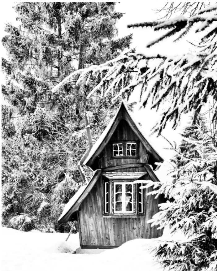
Hexenhaus, Lautenbacher Hexensteig

Auch nach Weihnachten ist im Renchtal ordentlich was los. Das Weinhaus Renner entführt seine Gäste am 20. Januar bei einer Rumprobe in die Welt des Zuckerrohrs und lädt am 1. Februar in die Winterlaube ein. Im Vinitorium der Oberkircher Winzer eG gibt es am 1. Februar Wein, Käsefondue und Zauberkunst und am 3. und 4. Februar findet Winter-Waldbaden mit Regine Oehler statt. Wer die Altstadt von Oberkirch mal in einem besonderen Licht sehen möchte, sollte die Fackelwanderung mit Glühweinverkostung am Weingut Bähr nicht verpassen. Sie wird am 1. Dezember, 12. und 26. Januar, 2. und 23. Februar und 1. März angeboten. Diese und noch viele weiteren Veranstaltungen sind im Flyer „Renchtäler Winterwochen“ der Renchtal Tourismus GmbH aufgeführt. Er ist in allen Servicestellen der Renchtal Tourismus GmbH sowie online unter www.renchtal-tourismus.de erhältlich.