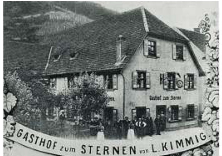
Gasthof zum Sternen ca. 1910

Die Gemeindeverwaltung nimmt gerne Fotos oder alte Postkarten entgegen, die für die Veröffentlichung im Verkündblatt und für Mitbürger interessant sind.