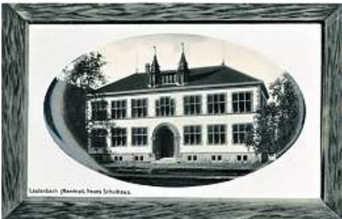
Abt-Wilhelm-Schule um 1909