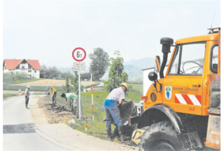
Bepflanzung Gewerbegebiet Lochmatt im Jahr 2000

Die Gemeindeverwaltung nimmt gerne Fotos oder alte Postkarten entgegen, die für die Veröffentlichung im Verkündblatt und für Mitbürger interessant sind.