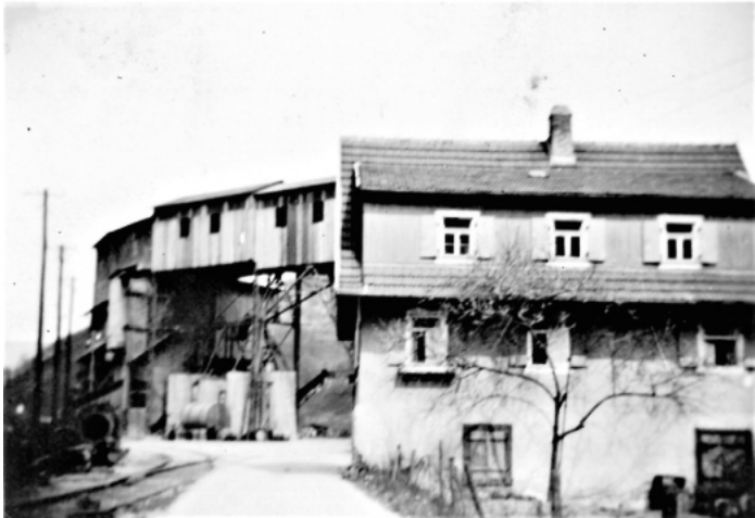
Schotterwerk Hubacker um 1939

Die Gemeindeverwaltung nimmt gerne Fotos oder alte Postkarten entgegen, die für die Veröffentlichung im Verkündblatt und für Mitbürger interessant sind.