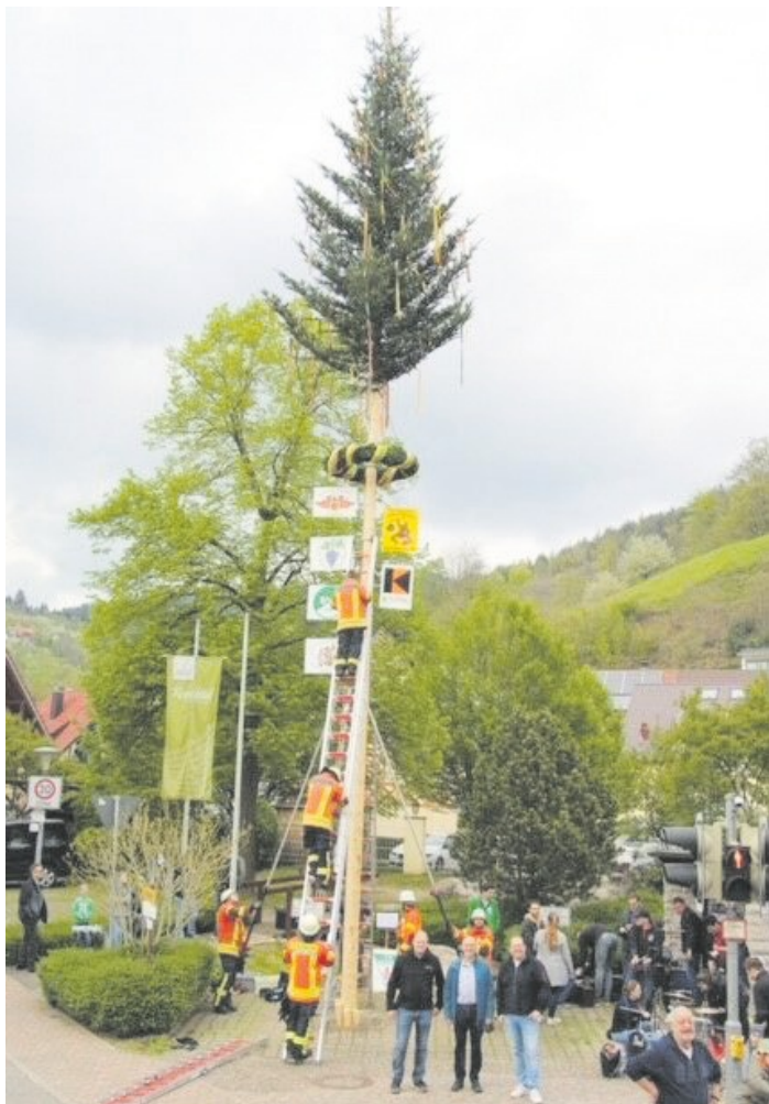
Zu den Klängen der Trachtenkapelle Lautenbach wurde am Samstag bei trockenem Wetter der Maibaum auf dem Dorfplatz beim „Bachdatscherle Brunnen“ aufgestellt. Foto: Text und Bild: Roman Vallendor