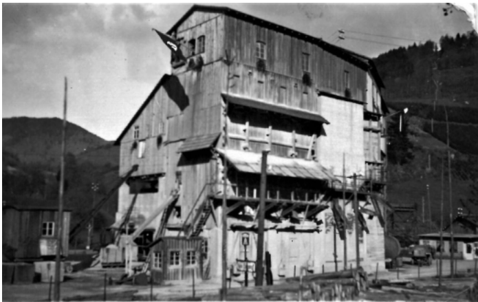
Schotterwerk Hubacker 1939

Die Gemeindeverwaltung nimmt gerne Fotos oder alte Postkarten entgegen, die für die Veröffentlichung im Verkündblatt und für Mitbürger interessant sind.