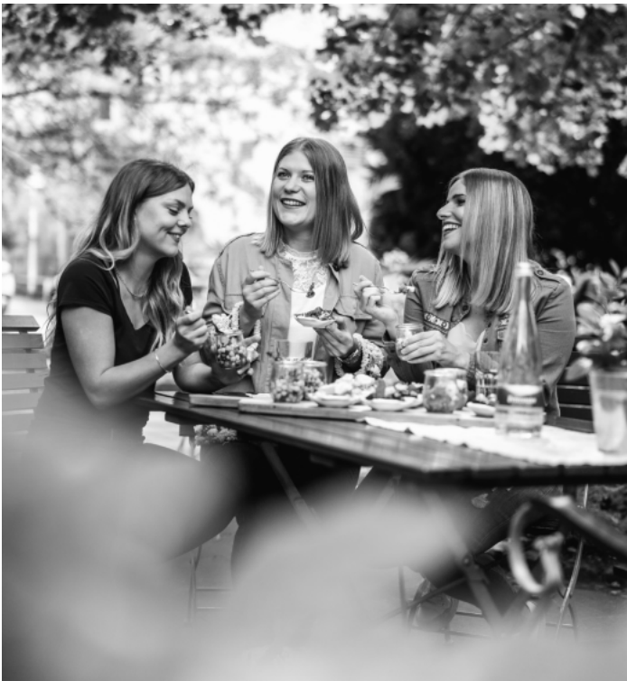
Angebote für Gruppen

Wir bitten um Veröffentlichung. Vielen Dank!