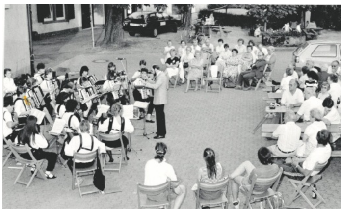
Konzert im Rathaushof Jahreszahl unbekannt

Die Gemeindeverwaltung nimmt gerne Fotos oder alte Postkarten entgegen, die für die Veröffentlichung im Verkündblatt und für Mitbürger interessant sind.