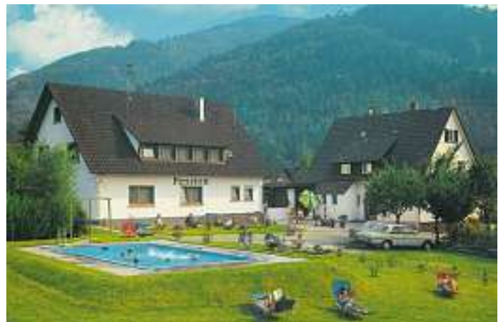
Cafe – Pension Waldblick um 1970