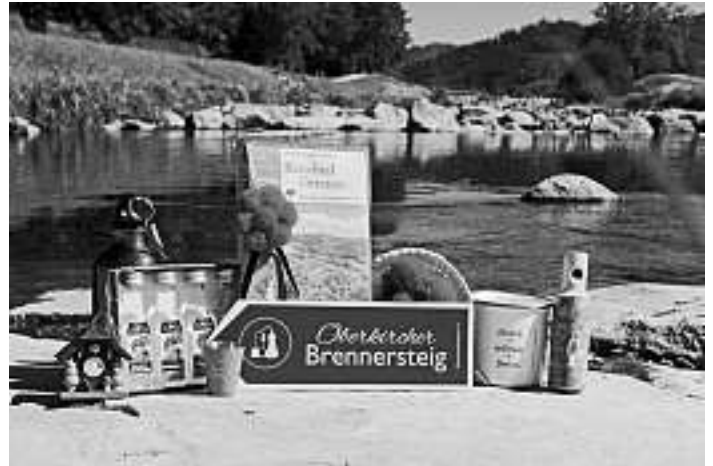
Souvenirs der Renchtal Tourismus GmbH

Der Online-Shop wurde in Zusammenarbeit mit der Firma Pixelpublic aus BadenBaden erstellt und ist direkt über die Seite www.renchtal-tourismus.de oder über www.renchtal-tourismus.shop erreichbar.