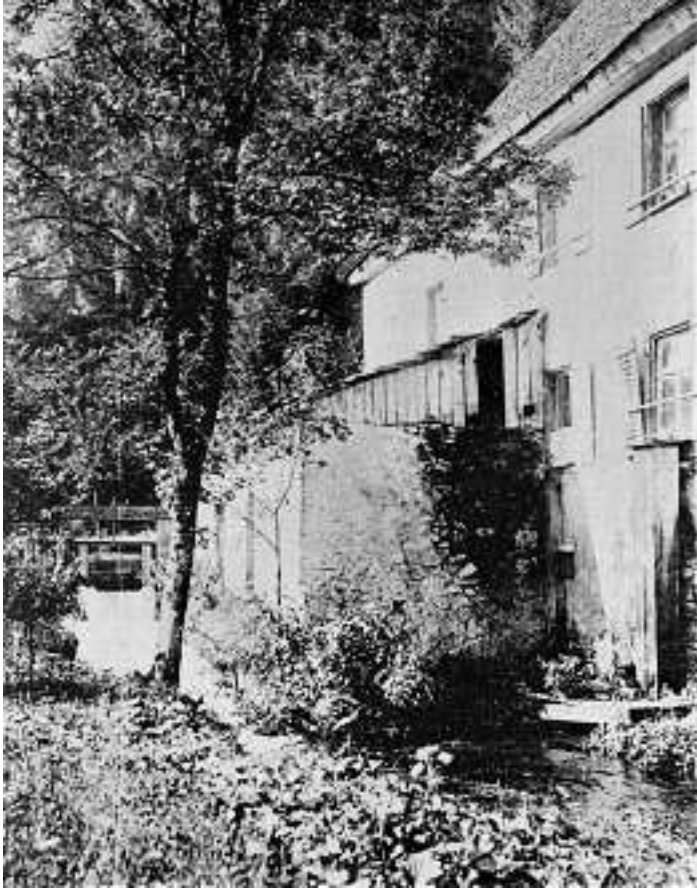
Lautenbacher Mühle um 1910 mit dem Mühlenkanal der an der Mühle entlang ging

Die Gemeindeverwaltung nimmt gerne Fotos oder alte Postkarten entgegen, die für die Veröffentlichung im Verkündblatt und für Mitbürger interessant sind. Die Fotos werden nur kurzfristig als Leihgabe benötigt und im Original wieder zurückgeben. Wer interessante Fotos oder historisches Material von Lautenbach hat und nicht mehr benötigt, kann diese auch gerne zur Archivierung im Rathaus abgeben. Ansprechpartner hierzu ist Frau Elke Müller 07802-925915 oder rathaus@lautenbach-renchtal.de