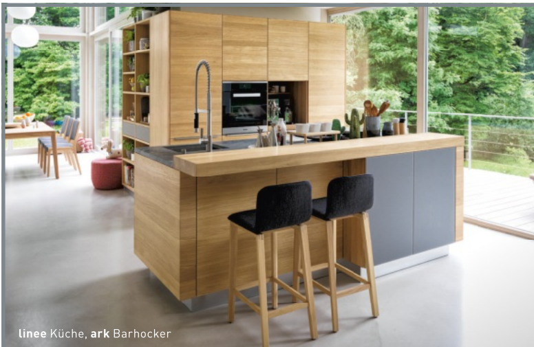
linee Küche, ark Barhocker