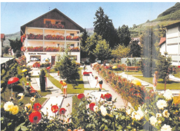
Minigolfanlage Gasthof Kreuz ca. 1980

Die Gemeindeverwaltung nimmt gerne Fotos oder alte Postkarten entgegen, die für die Veröffentlichung im Verkündblatt und für Mitbürger interessant sind. Die Fotos werden nur kurzfristig als Leihgabe benötigt