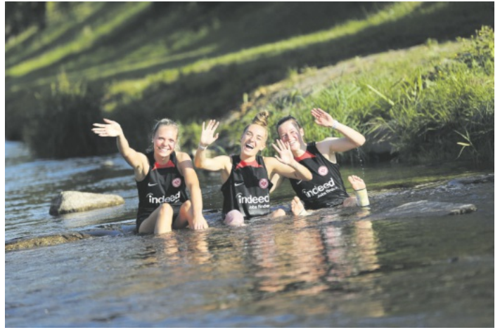
Spielerinnen von Eintracht Frankfurt kühlen sich nach dem Training in der Rench in Lautenbach ab