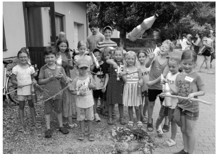
Mit fliegender Mondrakete und Elfenhaus im Vordergrund: Einige der teilnehmenden Kinder beim Ferienprogramm des Kirchenchors Lautenbach mit ihren Bastelarbeiten.

20 Kinder hatten viel Spaß beim „Nachmittag rund ums Buch“: Gebannt lauschten 20 Kinder im Bilderbuchkino beim Ferienprogramm des Lautenbacher Kirchenchors im Pfarrsaal hinter der Kirche der spannenden, aber auch lustigen Geschichte vom Räuber Hotzenplotz und der Mondrakete. Sie fieberten mit Kasperl und Seppel, die versuchten, den gefährlichen und vielleicht auch etwas dummen Räuber in eine selbstgebastelte Mondrakete zu befördern, um ihn schließlich nach einer holperigen Fahrt im Handkarren gut verpackt bei Wachtmeister Dimpfelmose abzuliefern. Die Bilder zur Geschichte wurden per Beamer gezeigt. Im Anschluss durfte jedes Kind seine eigene Mondrakete basteln und sich dabei gedanklich noch einmal mit der Geschichte beschäftigen. Mit Naturmaterialien wurden Räuberhöhlen und Elfenhäuser im Freien gestaltet. Es gab außerdem Malvorlagen und weitere Bastelangebote. Viel Anklang fanden leckere Kuchen und Muffins sowie selbstgemachter Beerensaft, mit dem die Helferinnen des Kirchenchors hungrige und durstige Kehlen bestens versorgten. Zum Abschluss konnten sich die Kinder auf dem nahegelegenen Spielplatz noch etwas austoben.