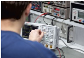
Einblick in die Lehrwerkstätten