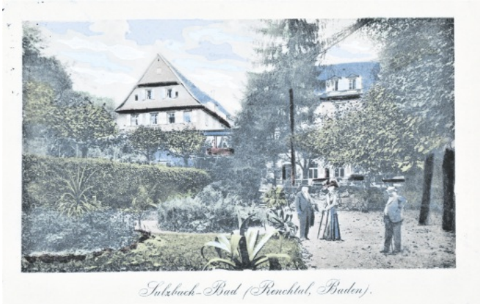
Sulzbach-Bad (Renchthal, Baden).