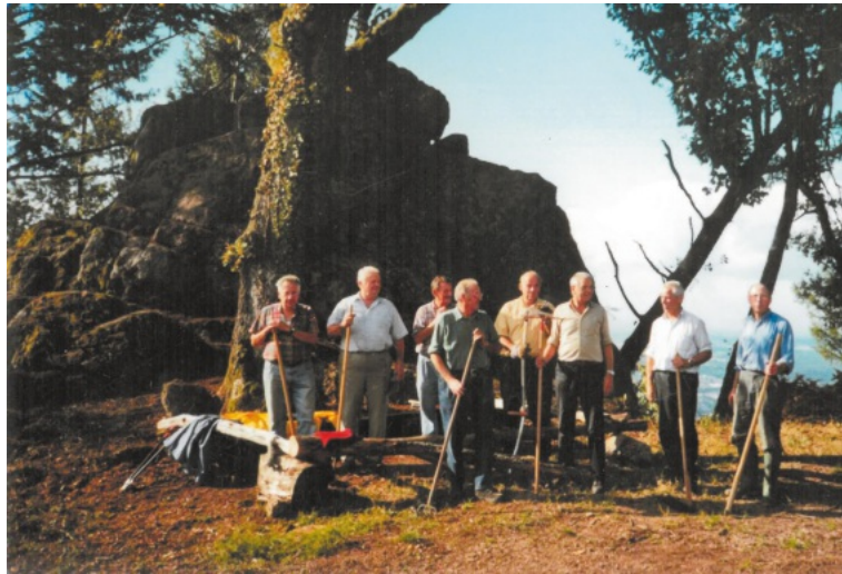
Donnerstagswanderer legen Otschenschrofen frei 2001

Die Gemeindeverwaltung nimmt gerne Fotos oder alte Postkarten entgegen, die für die Veröffentlichung im Verkündblatt und für Mitbürger interessant sind. Die Fotos werden nur kurzfristig als Leihgabe benötigt und im Original wieder zurückgeben.