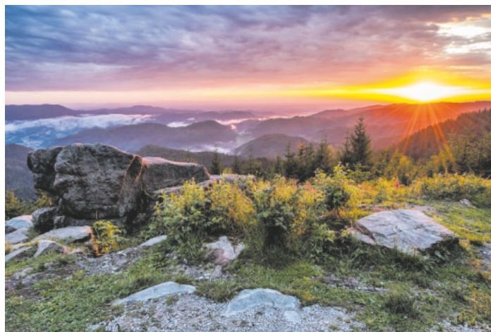
Titelbild Jubiläumskalender 2024

Der Kalender kann, zu den jeweiligen Öffnungszeiten, in den Servicestellen der Renchtal Tourismus GmbH in Oberkirch und Oppenau erworben werden. Der gesamte Erlös von 18,- € je Stück kommt der Bergwacht zugute, um auch zukünftig ihren wertvollen, ehrenamtlichen Einsatz zu gewährleisten.