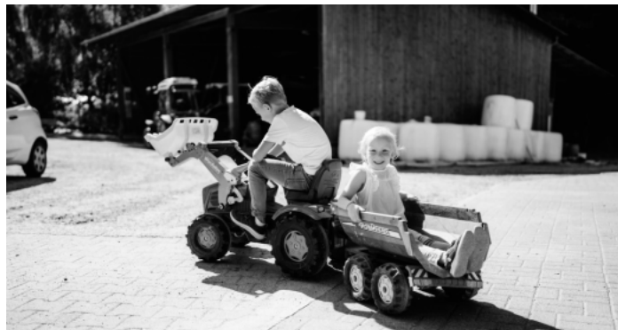
Familienzeit im Renchtal

Die Neuauflage „Ausflugskarte für Familien und Entdecker“ liegt in allen drei Servicestellen aus und steht digital unter www.renchtal-tourismus.de zum Download zur Verfügung. Auf Wunsch wird der Flyer gerne auch zugeschickt.