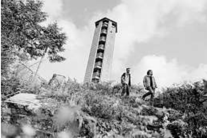
Wanderer auf dem Maisacher Turmsteig

Seit dem 17. Mai 2021 wird die Brücke an der Ortsverwaltung Maisacher bis voraussichtlich Ende September erneuert. Dies betrifft auch die Traumtour „Maisacher Turmsteig“: Der Wanderparkplatz sowie der Startpunkt wurden um etwa 200 Meter in Richtung Oppenau verlegt. Dieser befindet sich nun an der ehemaligen Säge. Die Wegstrecke zum Turmsteig wurde ausgeschildert, sodass dem Wanderer keinerlei Nachteile durch den Brückenbau entstehen. Ein weiterer Wanderparkplatz wurde nach der Baustelle auf der linken Seite am ehemaligen „Gasthaus Hirsch“ eingerichtet.