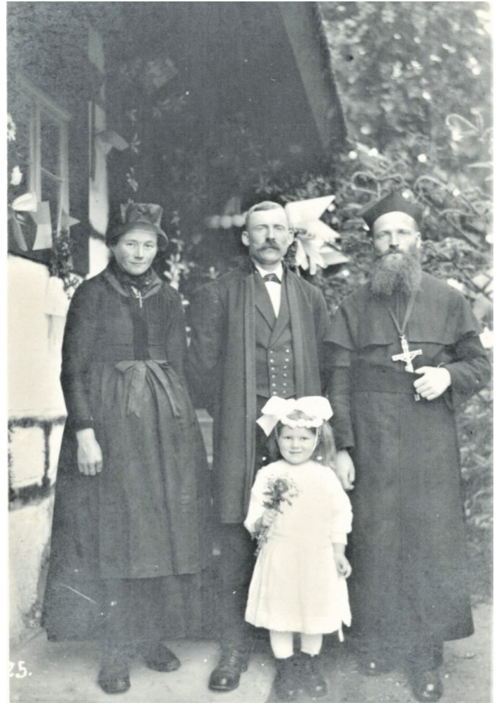
Bauernfamilie aus dem Sendelbach ca. 1920