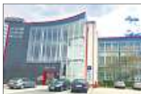
Zu Hause ist IMA Immobilien im Nestler-Carrée in Lahr.

Die IMA Immobilien GmbH ist ein inhabergeführtes, unabhängiges Unternehmen, das sich seit 1968 um alle Belange der Immobilienbranche kümmert. Vermittelt werden Grundstücke, Eigen-