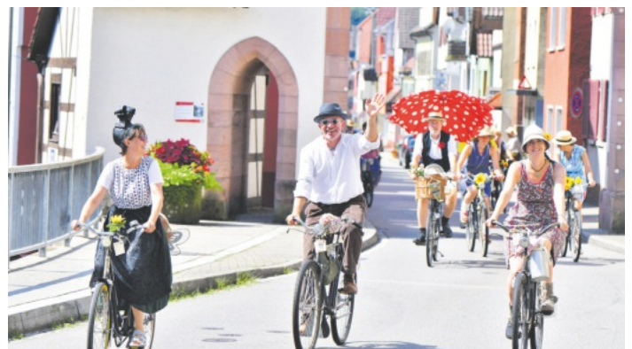
Die Ibacher Nostalgieradfahrt in Oppenau

Nach der Talfahrt treffen sich die Nostalgieradler auf der Hütte vom „Springhansenhof“ in Hinter-Ibach zur Radlerfete, dem gemeinsamen Abschluss mit Livemusik und Bewirtung. Hier wird es einen kleinen Wettbewerb geben: Zwischen allen Teilnehmern wird der Preis „Original Ibacher Nostalgieradler“ vergeben. Vom historischen Fahrrad über die Mode von „damals“ bis hin zu weiteren nostalgischen Accessoires - der Kreativität sind keine Grenzen gesetzt. Die historischen Fahrräder sowie die Kleidung sind selbst mitzubringen. Die Teilnahme erfolgt auf eigene Gefahr. Eine Anmeldung ist bis 5. Juli 2024 über die Homepage www.nostalgie-radfahren.de möglich, hier findet man zudem eine umfangreiche Bildergalerie mit Impressionen aus den letzten Jahren. Für alle Teilnehmer wird eine Startgebühr von 28,- Euro pro Person erhoben. Diese Tickets zur Anmeldung erhalten Interessierte auch über das Kulturbüro der Stadt Oppenau sowie online über www.reservix.de und an allen ekannten Vorverkaufsstellen. Weitere Informationen gibt es darüber hinaus bei der Renchtal Tourismus GmbH, Tel. 07802/82600 oder online www.renchtal-tourismus.de .