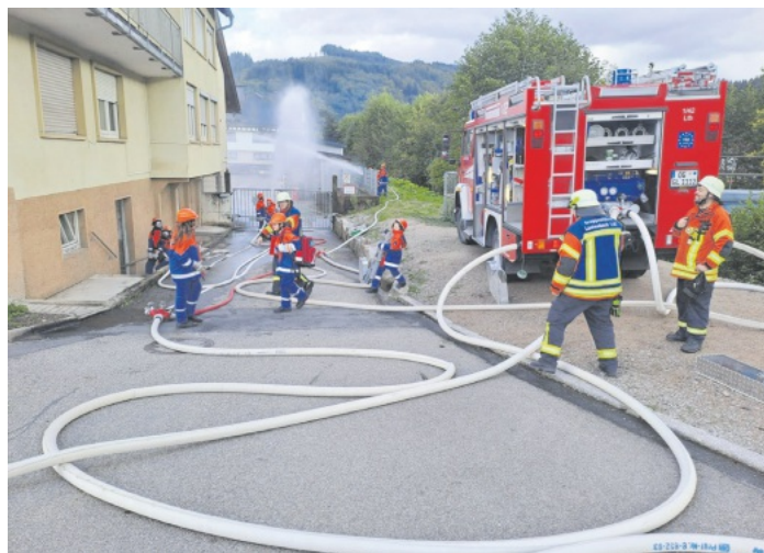
das 10/6 von Lautenbach beim Innenangriff und Löscharbeiten