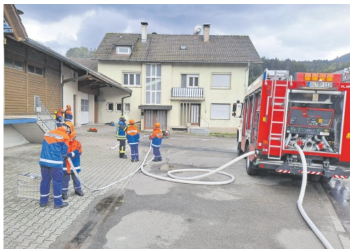
Das HLF Oppenau bei der Vorbereitung zum Innenangriff

Alle Aufgaben im Inneren des Gebäudes mussten mit Wasser am Strahlrohr gelöst werden. Eine besondere Herausforderung war die starke Verrauchung im Gebäude. Den Innenangriff durften die Nachwuchsfeuerwehrleute mit Atemschutzgeräten als Attrappen bestreiten.