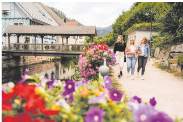
Auf Genusstour durch die Oppenauer Gastronomie

Tipp: Der Oppenauer Städtle-Hopser eignet sich auch als Geschenkidee!