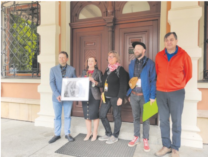
Treffen mit der Gemeindeverwaltung Schloss Koberwitz

Weitere Infos unter Tel. 0781/93603999 oder Mail: arge-biodyn-landbau-og@gmx.net