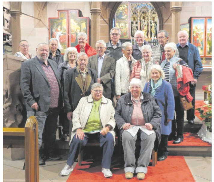
Die Heimatkirche mit anderen Augen sehen: Der Jahrgang 1943/44 beim Klassentreffen nach der Kirchenführung in der Wallfahrtskirche Mariä Krönung.

Die 80-Jährigen des Jahrgangs 1943/44 aus Lautenbach trafen sich zum Klassentreffen in ihrer Heimatgemeinde. Sie kamen aus Bayern, Franken und aus dem Schwabenlände, um mit den einstigen Klassenkameraden einen schönen Tag in Lautenbach zu erleben. Nach einem Sekt Empfang zur Begrüßung im Gasthof „Kreuz“ und einem guten Mittagessen saß man in froher Runde und tauschte Erinnerungen aus an alte Schultage. Der eine oder andere hatte noch ein „Geschichtle“ parat aus einer Zeit, die noch nicht vom Wohlstand geprägt, aber doch in schöner Erinnerung war. Nach einer sehr interessanten Kirchenführung in der Heimatkirche „Mariä Krönung“ und einem musikalischen Beitrag eines Klassenkameraden mit der Harmonika, wobei auch der verstorbenen Schulkameraden gedacht wurde, ging es gegen Abend noch einmal ins Gasthaus „Kreuz“, wo das Treffen seinen Ausklang fand.